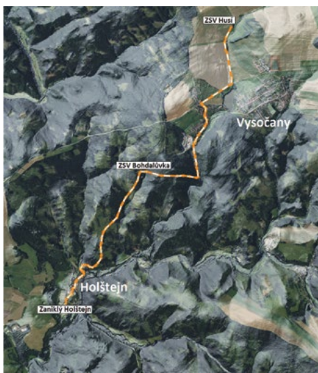
Předpokládaná trasa naučné stezky, ZSV Husí – ZSV Bohdalůvka – zaniklý Holštejn

Na lokalitách Husí a zaniklého Holštejna budou umístěny skleněné tabule, které při